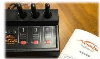
ネッシンプロフェッショナル (有)光輝